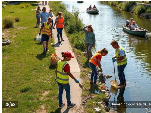
Immagine generata da IA