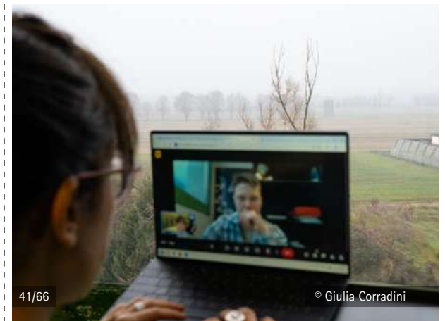
Immagine generata da IA